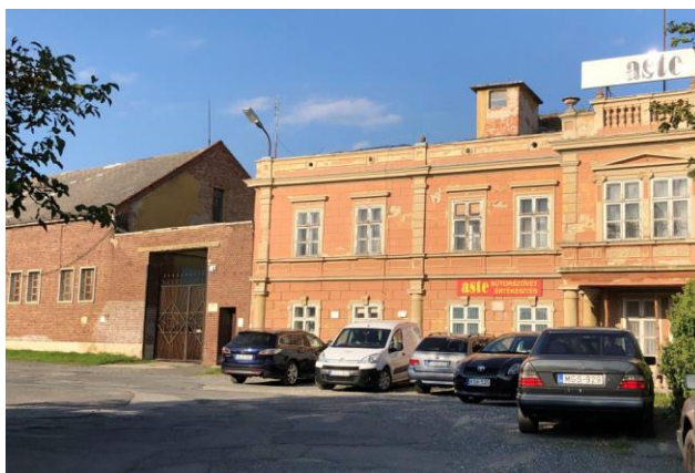
Az Ágyterítő- és Bütorszövetgyár épülete

Hadsereg parancsnoksága alá került, majd az 1948-as államosításkor Kőszegi Ágyterítő- és Bütorszövetgyár Nemzeti Vállalat néven folytatta tevékenységét. 1954 és 1958 között a Kőszegi Posztó- és Nemezgyár, valamint a Kőszegi Ágyterítő- és Bütorszövetgyár egyesüléséből létrejött Kőszegi Textilművek gyáraként működött, majd 1958-tól ismét önálló vállalat lett. 1963. január 1-jén megalakult a Lakástextil Vállalat és az Ágyterítő- és Bütorszövetgyár is – Kőszegi Bütorszövetgyár néven – ehhez csatolták. A gyár 1995-ben német tulajdonba került, ASTE Hungária Bütorszövetgyár Rt. néven folytatta működését, majd 2000-ben három magyar magánszemély vásárolta meg és ASTE Hungária Lakástextilgyártó Kft. néven üzemeltette. A cég a kereslet csökkenése miatt tönkrement, felszámolták és beolvadt a MERITUM Kft.-be, amely az ASTE márkanévet megtartva bütorszövetek és lakástextiliák gyártásával és kereskedelmével foglalkozik.