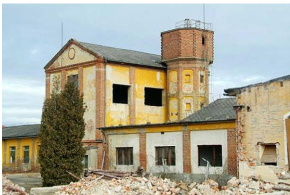
A toronyépület, amelyet műemlékké kívántak nyilvánítani

1949-ben megtörtént mindkét gyár államosítása és a két gyár mint Kőszegi Nemez- és Posztógyár Nemzeti Vállalat működött tovább 1957-ig, amikor is Kőszegi Posztó- és Nemezgyár Nemzeti Vállalattá nevezték át, mert addigra a posztógyár termelése vált hangsúlyosabbá. Az 1960-as évektől jelentős profilváltozás következett be: a felgyorsult lakásépítési program folytán megemelkedett a bútorszövetek, függönyök és más lakástextiliák iránti igény és ennek következtében új technológia is megjelent a gyárban: a Malimo típusú varrvahurkolt kelmék gyártása. 1963-ban a vállalatot a szombathelyi központú Lakástextil Vállalathoz csatolták. Az 1980-as években azután nagy mennyiségű gépkocsi-üléshuzatot is készítettek. A következő években aztán sajnos folyamatosan csökkent a termelés, majd végül be kellett zárni a gyárat. Bár az épület toronyépületét a város műemlékké akarta nyilvánítani, azt egy vállalkozó ezt megelőzően 2008-ban engedély nélkül lebontotta. Az ügyből nagy botrány kerekedett és végül – több éves pereskedés után – az elkövetőket el is ítélték. Az épület helyén ma élelmiszer-áruház és mellette a fentebb említett Emlék-hely működik.