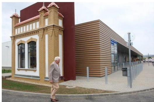
Ennyi maradt – A Kőszegi textilipar emlékhelye